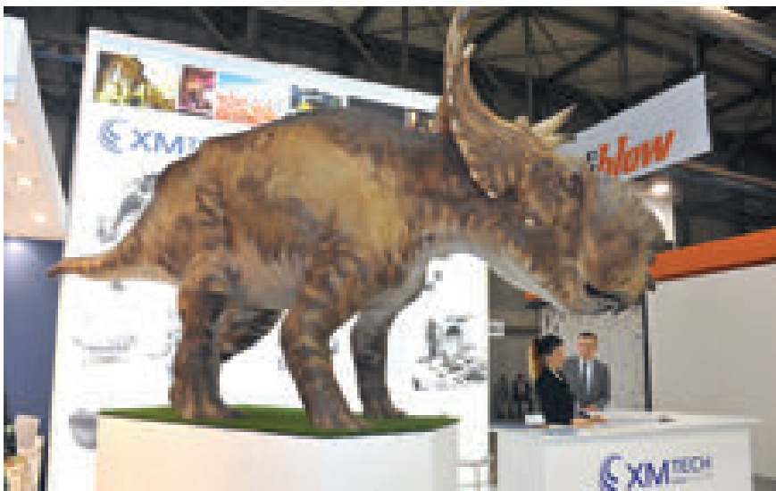
Oltre alle innovazioni tecnologiche e nel campo dei materiali, varie curiosità caratterizzano i padiglioni della triennale milanese dedicata al settore materie plastiche e gomma

Le iscrizioni per gli espositori si apriranno nelle settimane successive al K 2016 e vi saranno novità sia nei servizi inclusi sia negli incentivi per le iscrizioni tempestive,